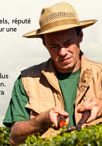
Taille des buis aux jardins de Marqueyssac