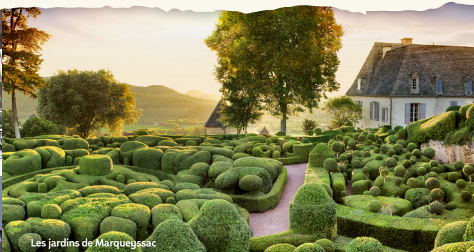
Les jardins de Marqueyssac