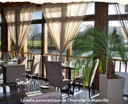
La salle panoramique de l'Hostellerie Maleville