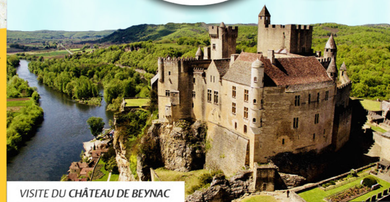
VISITE DU CHÂTEAU DE BEYNAC

VENEZ DÉCOUVRIR LA VALLÉE DES 5 CHÂTEAUX